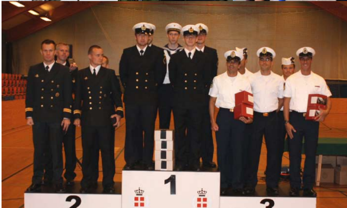
Vinderceremonien på SSG