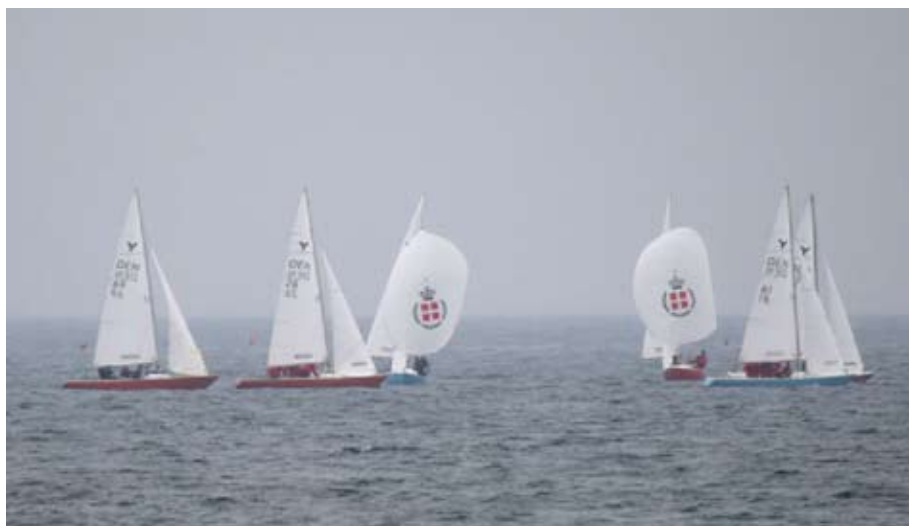
Fra team race sejladserne

De danske Christianiacykler vakte interesse hos flere af de udenlandske deltagere