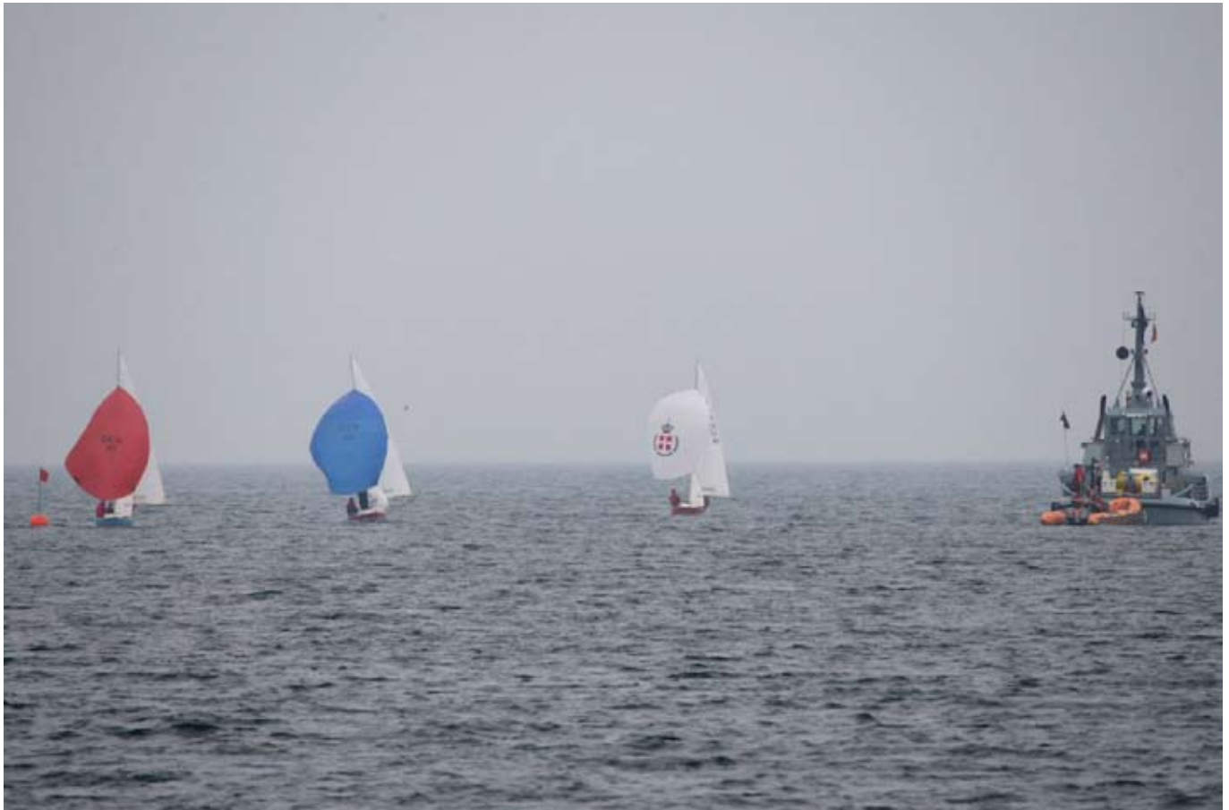
Fra team race sejladserne

Detaljerede resultatlistor kan ses på denne web adresse: http://www.nmm2010.dk/Index.htm (der er også en link fra SIF siden)