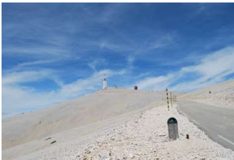
Udsigt fra sadlen

Efter en hyggelig omgang grill blev aftenen tilbragt med en turnering i petanque med dertil hørende ost og vin.