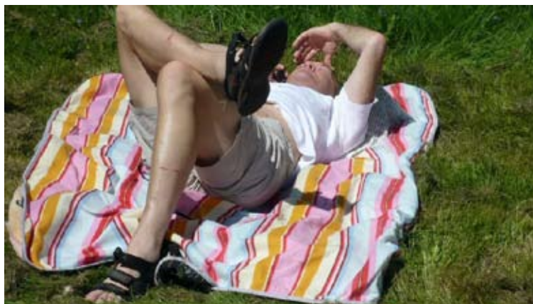
Der var plads til andet end cykling

SIF Frederikshavn Cykeludvalg, deltog, med 12 veltrænede ryttere ved DMI i Landevejscykling, afholdt af Hærens Officersskole i området omkring Haslev ved Køge, i dagene den 2-3. Juni 2010