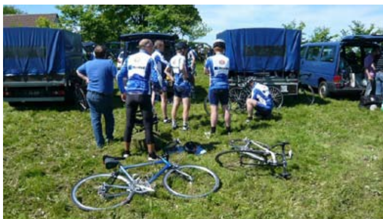
Cykler og ryttere gøres klar

Resultatslisten kan ses i sit fulde omfang på EVENT4YOU hjemmeside, der blev kørt rigtig stærkt kan jeg afsløre.