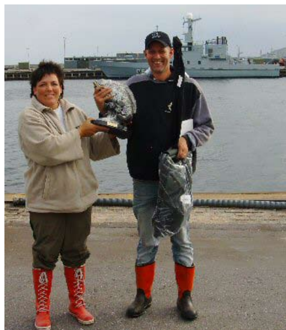
Sæsonnens største fisk