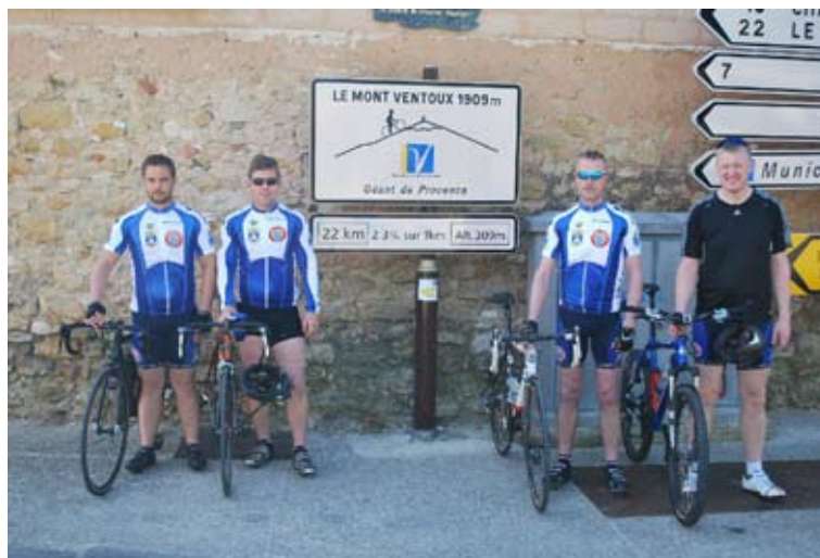
Rytterne er klar til dagens udfordringer

Der var blevet lejet et hus til indkvartering i byen Flassan med kun 350 indbyggere, og med kun 7 km til startstregen i Bedoin havde den perfekte beliggenhed. Hele området var alt det man forbinder med Frankrig. Kuperet terræn, vinstokke, gamle huse og smalle gader. Byen Flassan er bestemt ikke plaget natteliv og technomusik, for de eneste attraktioner var en købmand, kirke, restaurant og en telefonboks, men havde til gengæld alt det vi havde brug for, nemlig masser af ro og fred.