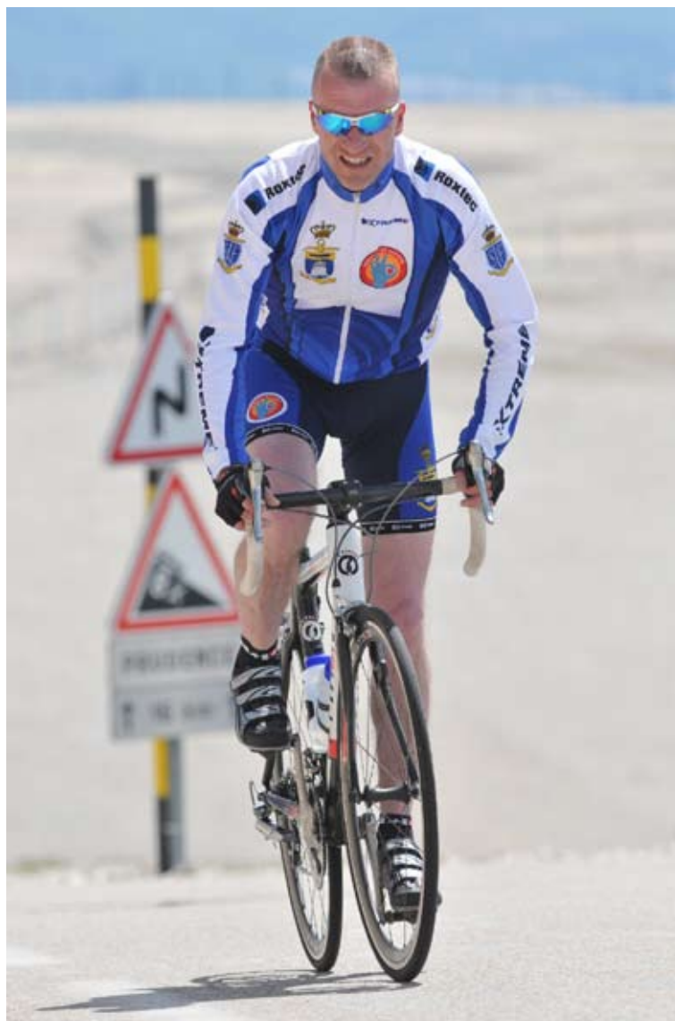
Der trædes - og svedes

Herefter fik vi tid til at sove nogle timer inden bilerne skulle pakkes og turen gik tilbage til Danmark. Vi nåede dog lige at stoppe ved grænsen og få handlet det sidste. Det blev en super god tur, og slutteligt vil undertegnede bare sige tak for indsatsen, og for den gode stemning på hele turen.